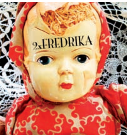
2x Fredrika/vägröjarna. Trombon kl 19