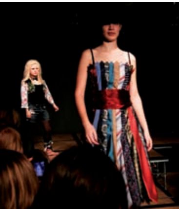
Modevisning. Stadshusets trappa kl 17