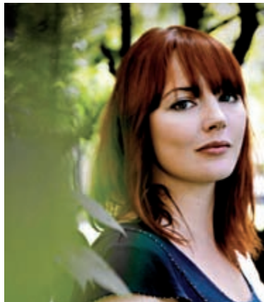
Filmen Prinsessa. Estrad kl 14.30 och 21.30