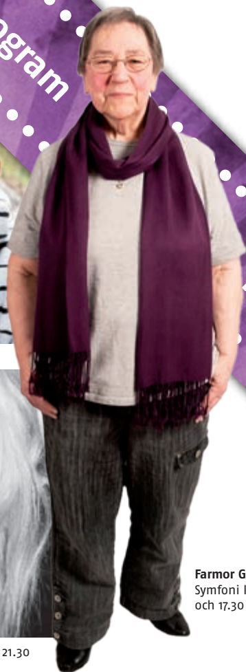
Farmor Gun. Symfoni kl 13.00 och 17.30