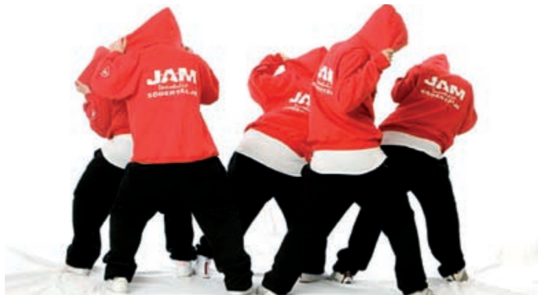
Jam. Trombon kl 21.30