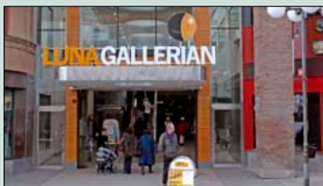
Entrén från Gågatan