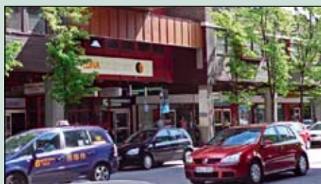
Entrén från Nygatan