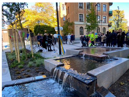
Kanaltorget intill Köpmangatan.