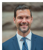
Johan Forssell (M) Riksdagsledamot och migrationspolitisk talesperson