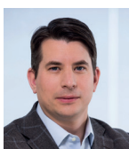
Jonas Nygren Förbundschef för Hyresgästföreningen och regeringens utredare Delegationen mot segregation