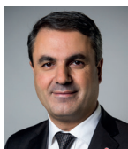
Ibrahim Baylan (S) Samordnings- och energiminister och ansvarig minister mot segregation