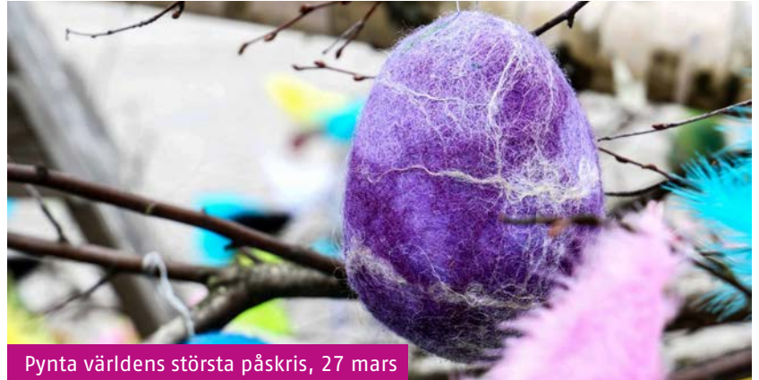
Pynta världens största påskris, 27 mars