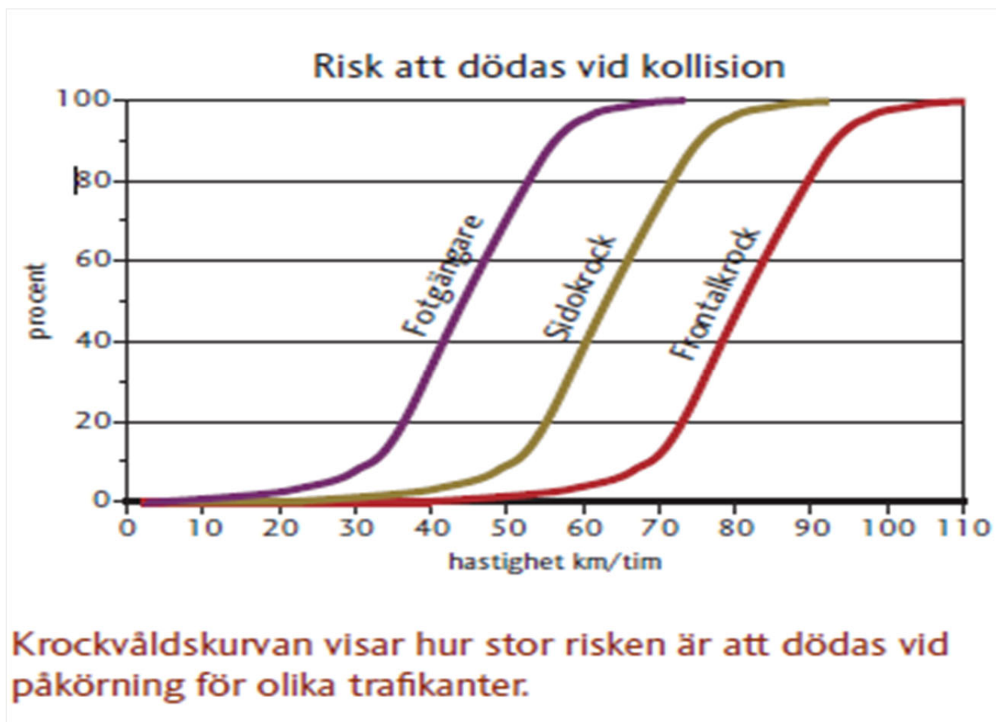
Figur 1. Krockvårdskurvan visar hur stor risken är att dödas vid påkörning för olika trafikanter (SKLs "Rätt fart i staden")