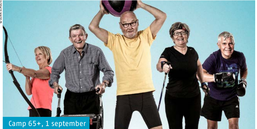
Camp 65+, 1 september