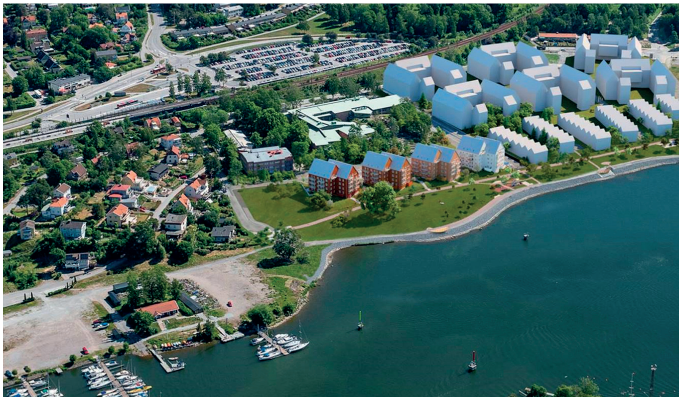
Visionsbild på de fyra Kanalhusen som planeras stå klara 2021.