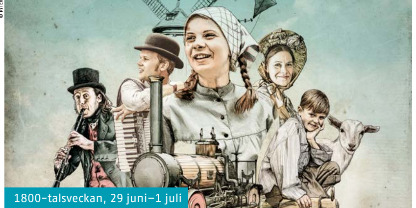
1800-talsveckan, 29 juni–1 juli