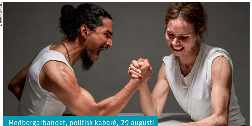
Medborgarbandet, politisk kabaré, 29 augusti