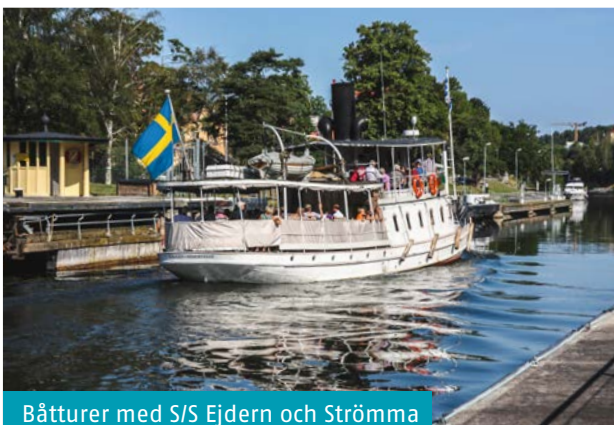
Båtturer med S/S Ejdern och Strömma