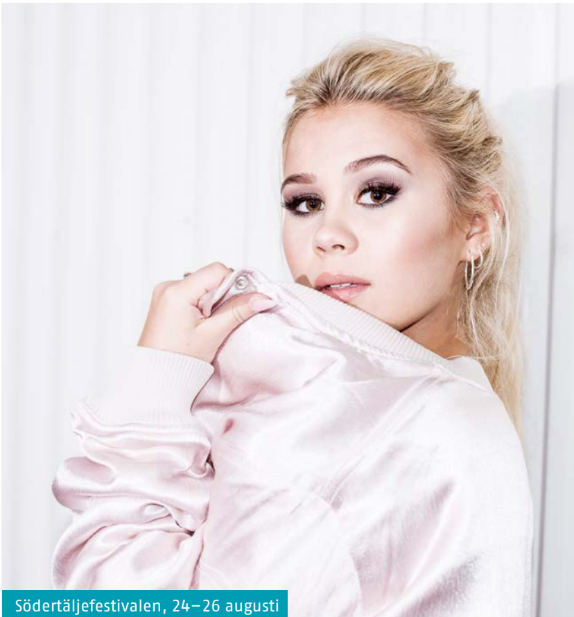
Södertäljefestivalen, 24–26 augusti