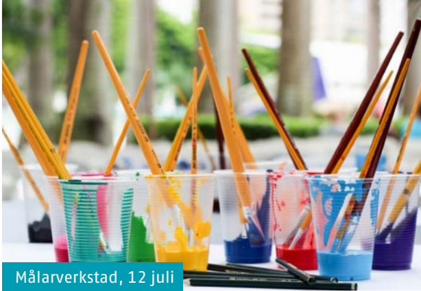
Målarverkstad, 12 juli