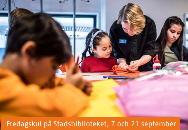
Fredagskul på Stadsbiblioteket, 7 och 21 september