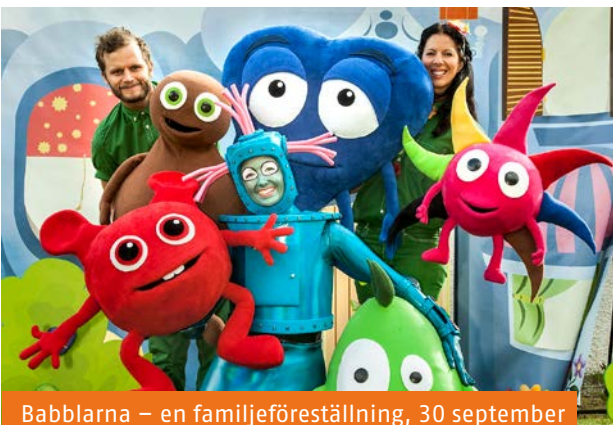
Babblarna – en familjeföreläsning, 30 september