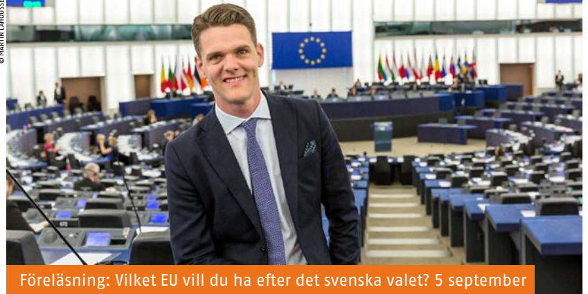
Föreläsning: Vilket EU vill du ha efter det svenska valet? 5 september