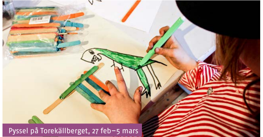
Pyssel på Torekällberget, 27 feb–5 mars