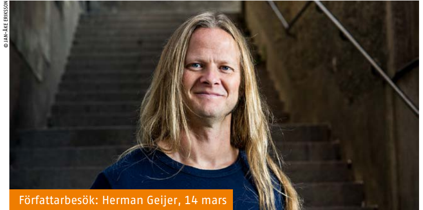
Författarbesök: Herman Geijer, 14 mars