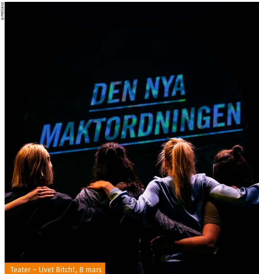
Teater – Livet Bitch!, 8 mars