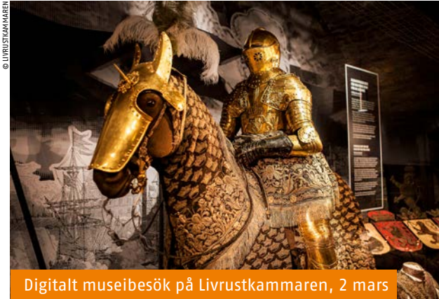
Digitalt museibesök på Livrustkammaren, 2 mars