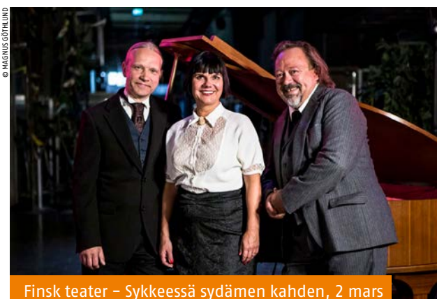
Finsk teater – Sykkeessä sydämen kahden, 2 mars