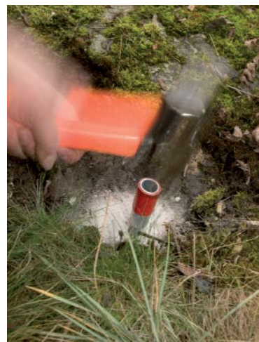
Markerar i terrängen...