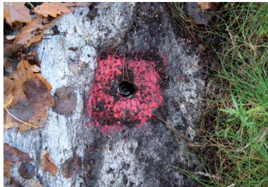
Hål i berg