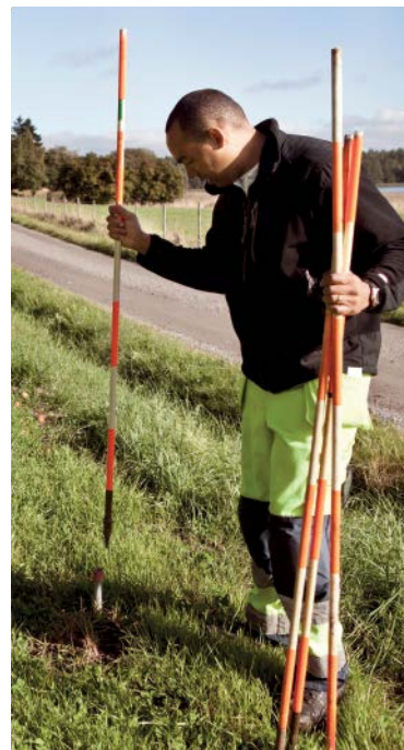
Stakar ut gränser...

Så här kan en fastighetsbestämning gå till: