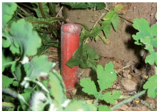
Rör i marken