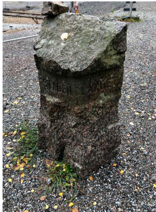
På museiområdet finns denna sten med väganvisning till Staden respektive Landet.