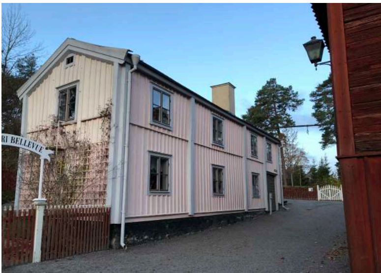
Området karaktäriseras av en småskalig trähusbebyggelse som ska spegla den förindustriella 1800-talsstaden. Syns Tabermansgatan med låga trähus i två våningar. Våningsplanen är markerade med en list som bryter av fasaden av locklistpanel.

Husen är flyttade men är historiska objekt i en bebyggelsemiljö och ett kulturhistoriskt sammanhang som har funnits i 90 år på platsen.