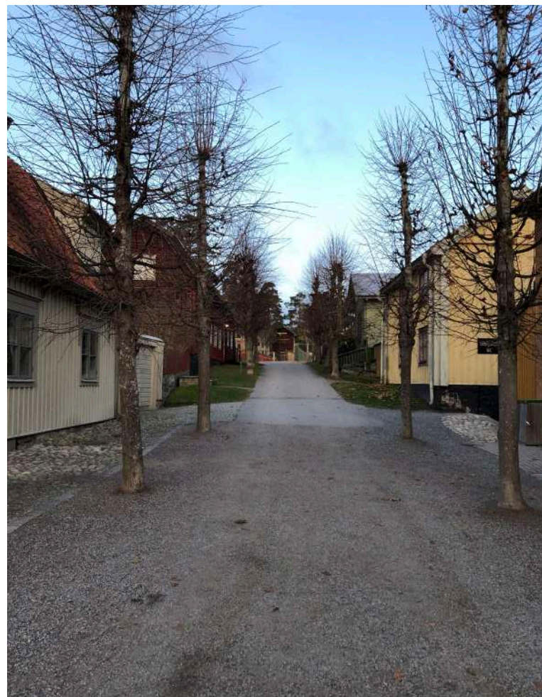
Genom friluftsområdet löper grusade gränder. Till vänster syns det centrala museistråket från dagens huvudentré till torget..