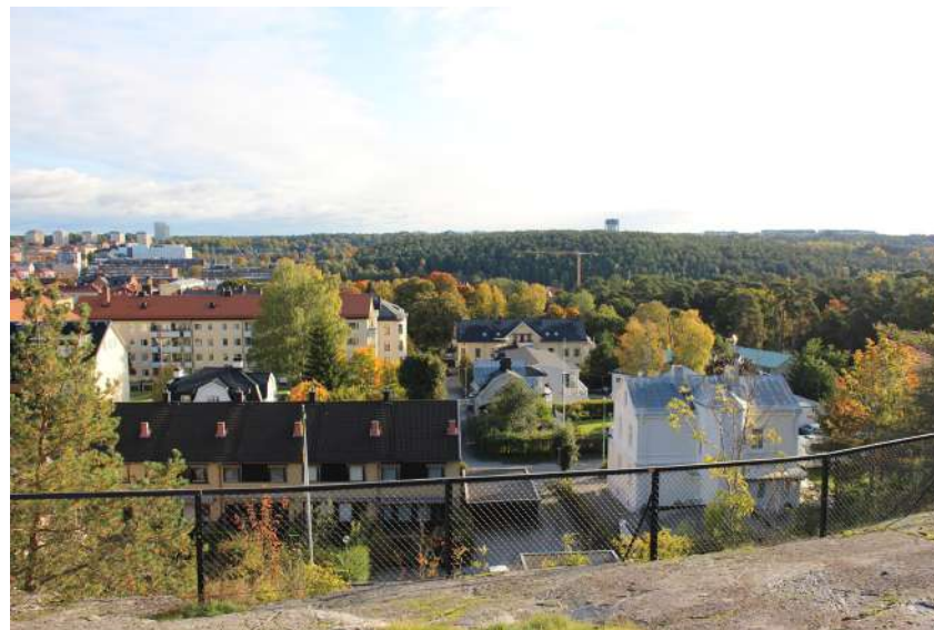
Utsiktsplatsen intill väderkvarnen har betydelse som besöksplats för Södertäljebor. Höjden korresponderar med den skogsbeklädda Kusens backen på östra sidan av kanalen och är ett viktigt inslag i stads- och landskapsbilden.