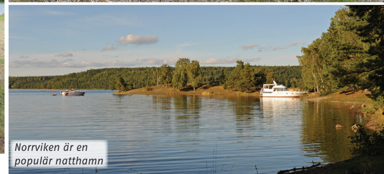
Norrviken är en populär natthamn