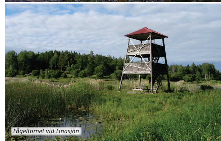
Fågeltornet vid Linasjön