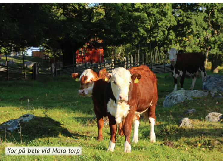
Kor på bete vid Mora torp

Området är också fullt med kulturhistoriska spår från forntid till nutid. Spana efter forngravar, stengärdesgårdar och husgrunder eller besök det mysiga torpet Mora torp i sydvästra delen av reservatet.