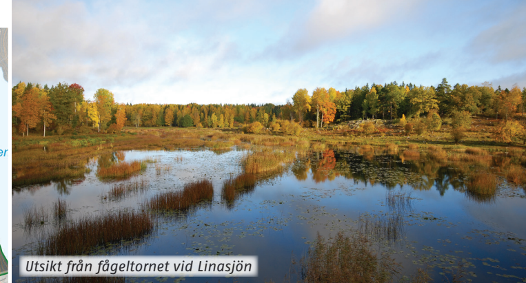
Utsikt från fågeltornet vid Linasjön

Det finns även ett flertal andra promenadslingsor och markerade stigar i reservatet som visar upp området. I västra delen av reservatet finner du Mora torp som legat här sen 1600-talet med en fin grillplats och informationstavlor där du kan läsa om alla naturreservat i Södertälje kommun. Reservatstavlor med skyltar hittar du vid alla större entréer till reservatet.