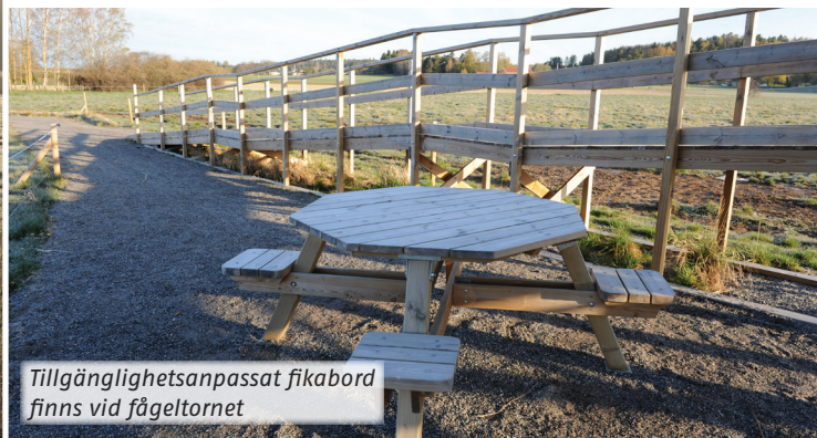
Tillgänglighetsanpassat fikabord finns vid fågeltornet

Vid fågeltornet kan du välja på två rastbord. Ett tillgänglighetsanpassat precis vid tornet och ett som står en bit ifrån vid vattnet. Fikat kan du äta uppe i tornet där det finns en enklare bänk. Uppe i tornet kan du läsa mer om betade strandängar och naturvärdena. Här finns en brevlåda med en bok där du kan skriva ner dina naturobservationer och läsa om andras.