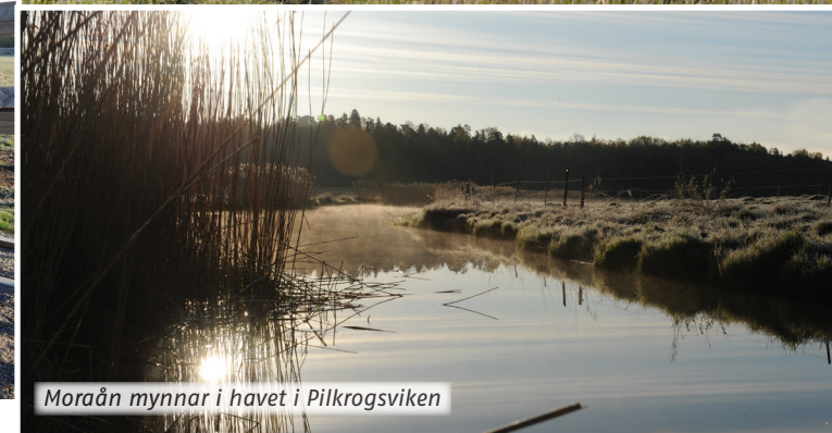
Moraån mynnar i havet i Pilkrogsviken