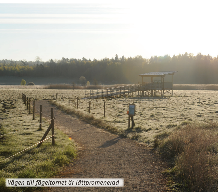
Vägen till fågeltornet är lättpromenerad