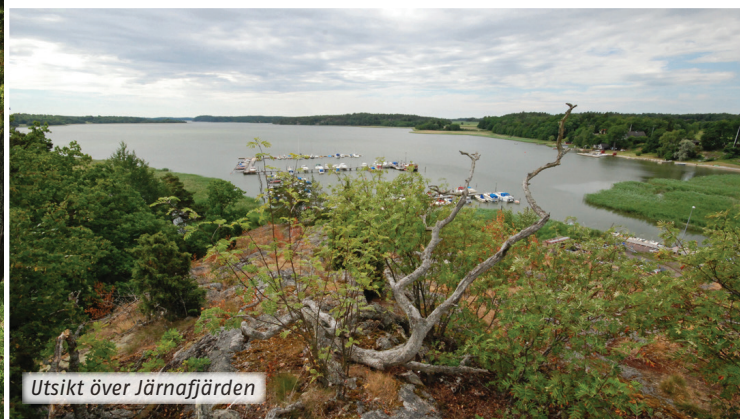
Utsikt över Järnafjärden

Fortsätter du in i hagen och följer stigen österut passerar du havsstrandängar innan du kommer ut på en vacker udde. Här finns den enda tillåtna eldplatsen i området där du kan grilla eller njuta av en fika. Udden är också en populär badplats. Även de vackra strandängarna längre norrut i reservatet samt den fina betespåverkade skogen som är rik på svamp, är värda en promenad och närmare titt.