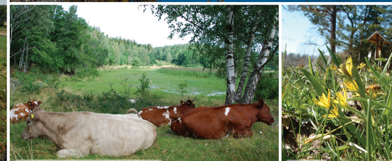
Kör betar på strandängarna