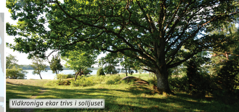
Vidkroniga ekar trivs i solljuset