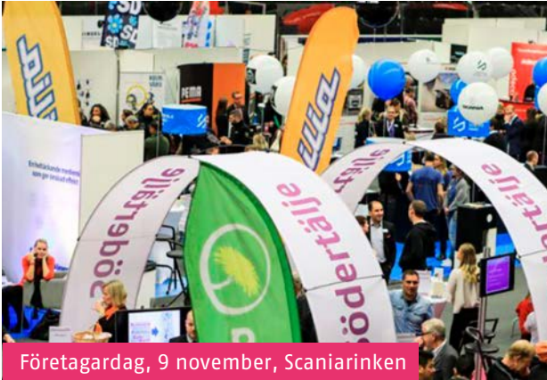
Företagsdag, 9 november, Scaniarinken