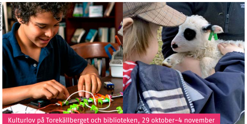
Kulturlov på Torekällberget och biblioteken, 29 oktober–4 november