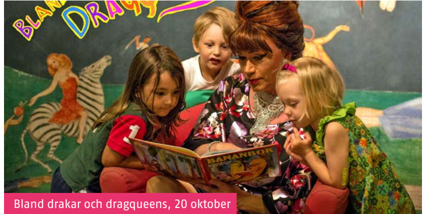
Bland drakar och dragqueens, 20 oktober