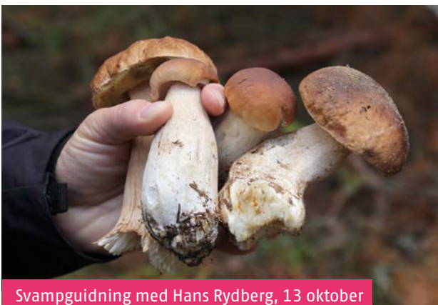
Svampguidning med Hans Rydberg, 13 oktober