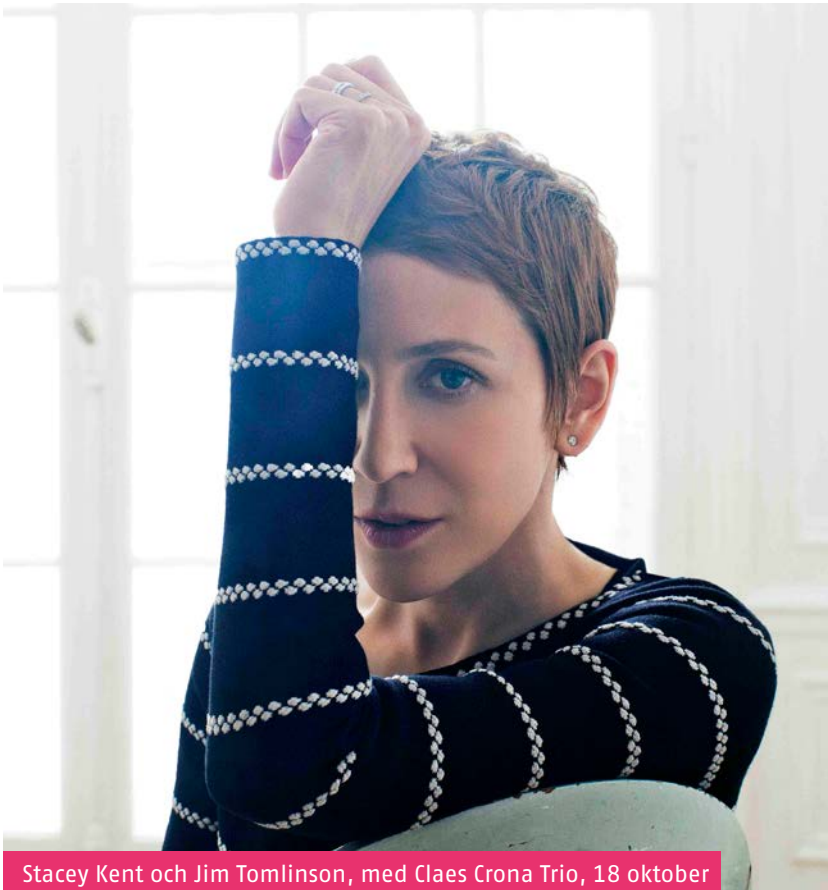
Stacey Kent och Jim Tomlinson, med Claes Crona Trio, 18 oktober