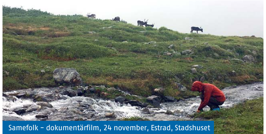
Samefolk – dokumentärfilm, 24 november, Estrad, Stadshuset