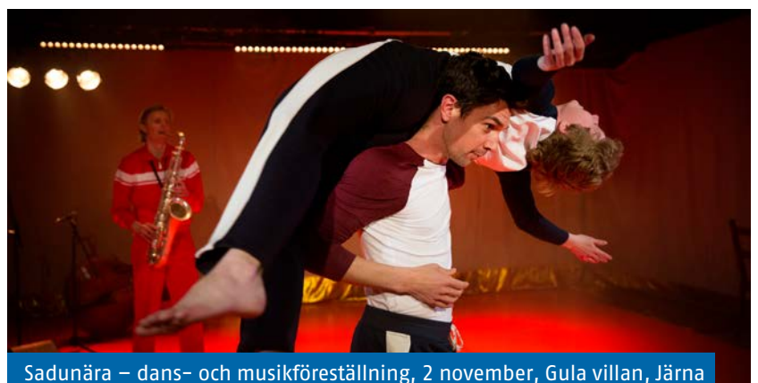
Sadunära – dans- och musikföreläsning, 2 november, Gula villan, Järna