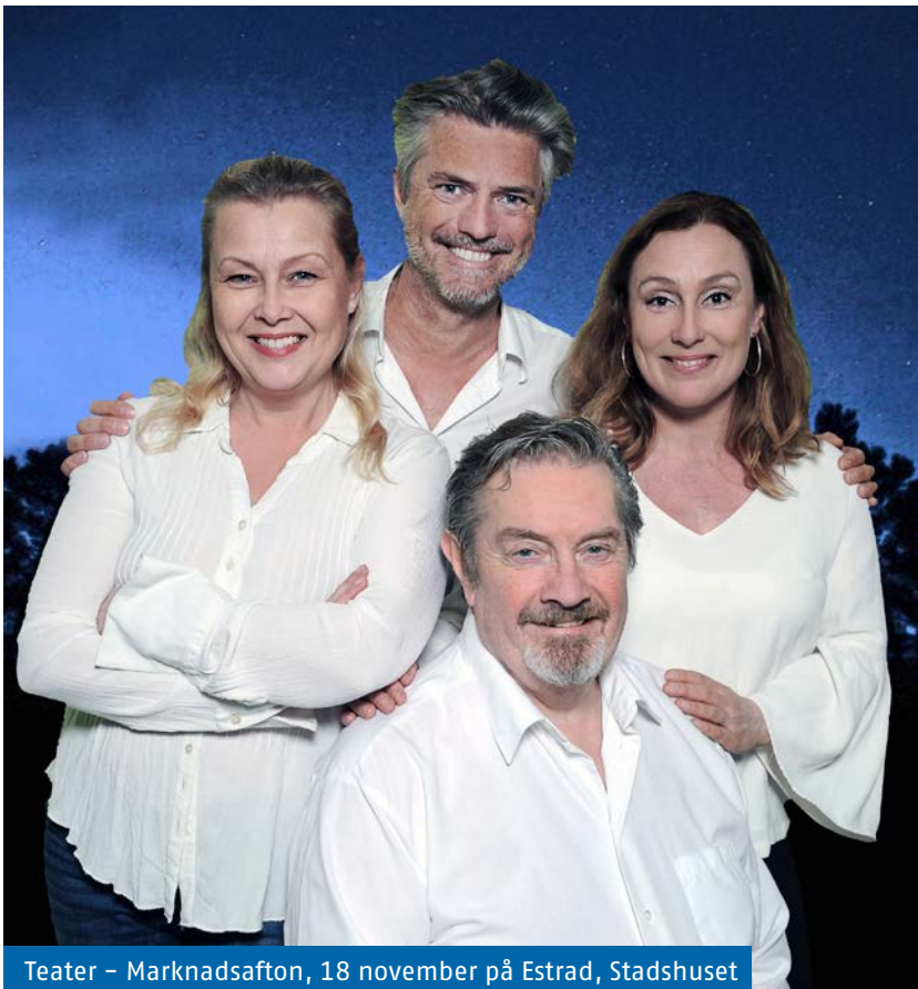
Teater – Marknadsafton, 18 november på Estrad, Stadshuset