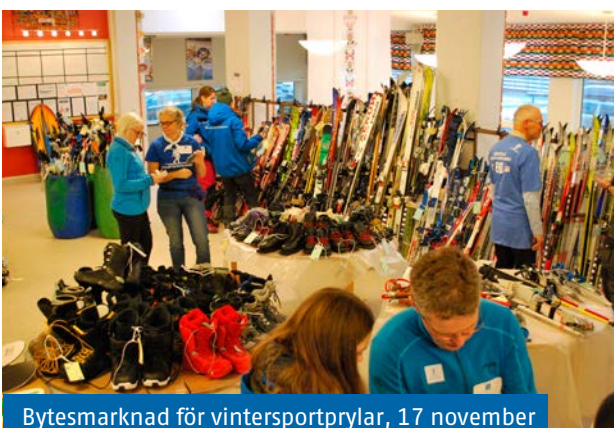
Bytesmarknad för vintersportprylar, 17 november