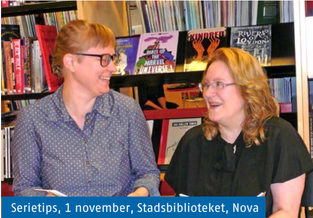
Serietips, 1 november, Stadsbiblioteket, Nova