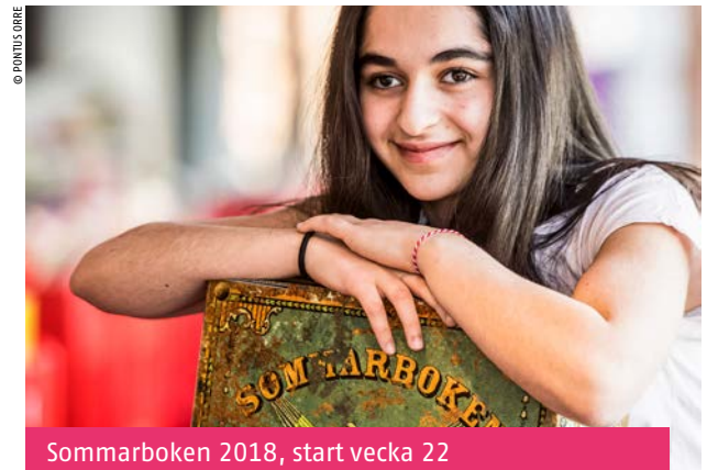
Sommarboken 2018, start vecka 22