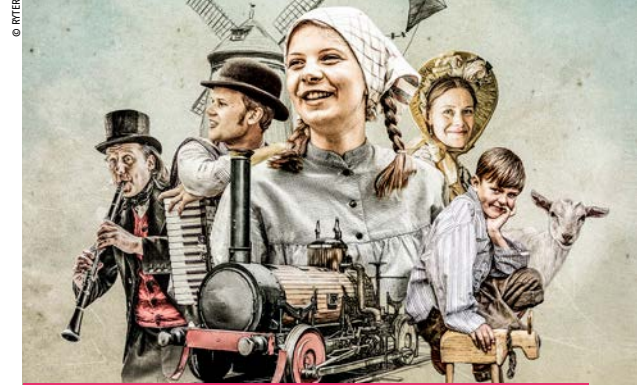
1800-talsveckan på Torekällberget, 29 juni–1 juli