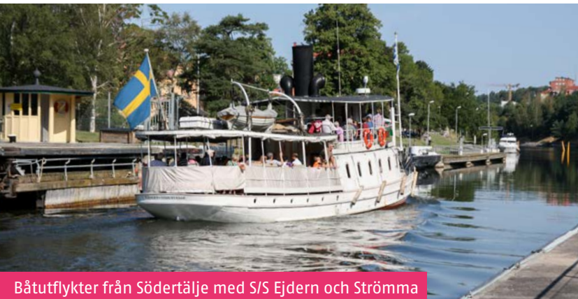
Båtutflykter från Södertälje med S/S Ejdern och Strömma