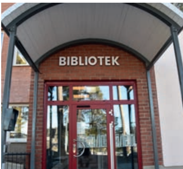
Den nya entrén till Hölö bibliotek

Sedan ett par år tillbaka är Hölö bibliotek, det som ligger i skolan, också ett fullt öppet folkbibliotek för de boende i kommundelen.