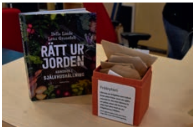
På Hölö bibliotek kan du låna allt från böcker till verktyg och fritidsutrustning. Här finns också ett fröbibliotek.