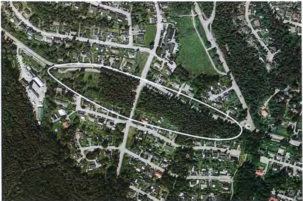
Detaljplaneområdets ungefärliga läge markerad vit.

Samhällsbyggnadskontoret föreslår att Järna kommunstyrelsen ger kontoret i uppdrag att upprätta ny detaljplan för del av Nykvarnsvägen samt att skicka ut detaljplanen på samråd.