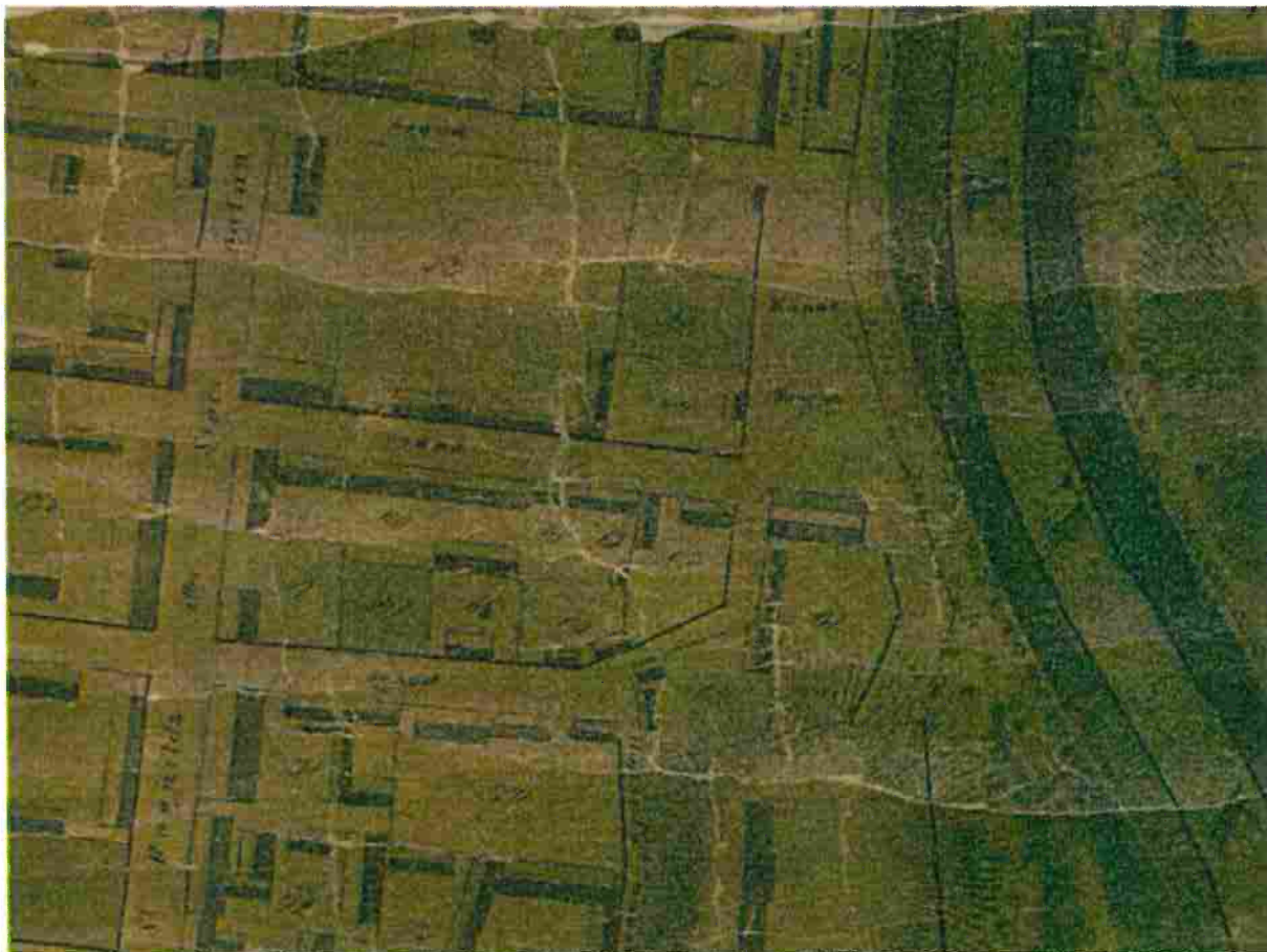
Kanaltorget invid gamla Södertälje kanal år 1857