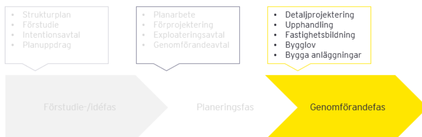
Processbild: Planeringsarbetet för utbyggnadsprojekt inom samhällsbyggnadsprocessen