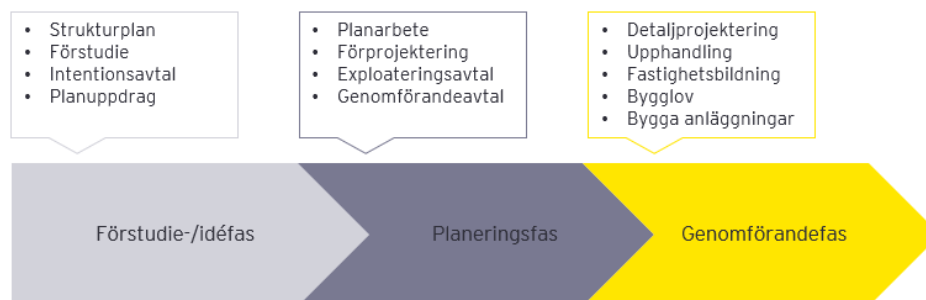
Processbild: Planeringsarbetet för utbyggnadsprojekt inom samhällsbyggnadsprocessen

I enlighet med kommunens investeringsprocess ska en förstudie tas fram för nya investeringsbehov. Nedanstående skiss beskriver en grov indelning för hur planeringsarbetet sker inom ramen för utbyggnadsprojekt inom samhällsbyggnadsprocessen. Dessa avser främst projekt i enlighet med projektmodellen men genomförandet av övriga projekt, såsom utveckling av gator, parker, parkering mm. följer liknande struktur.