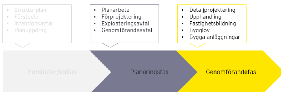
Processbild: Planeringsarbetet för utbyggnadsprojekt inom samhällsbyggnadsprocessen

Nämndbeslut om investeringar fastställs i verksamhetsplanen. Nämndens deltagande enligt processkartan varierar beroende av projekttyp, men sker främst i planerings- och genomförandefasen (mål- och budget).