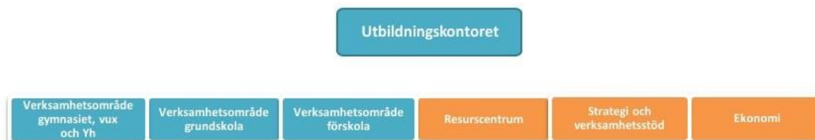
Bild hämtad från utbildningsnämndens verksamhetsplan 2022

Utbildningsnämnden ansvarar för den pedagogiska verksamheten för barn och ungdom. Utbildningskontoret har följande organisering: