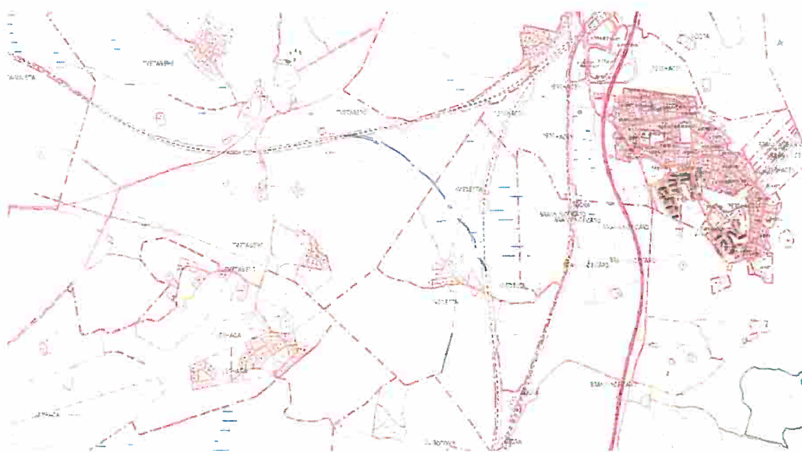
Bild 4: Karta med planerat ”Triangelspår” för koppling mellan Svealandsbanan respektive Stambanan

Södertälje kommun har föreslagit en järnvägskoppling, även kallad ”Triangelspåret” mellan Svealandsbanan och Stambanan till Trafikverket och kommunen verkar för att kopplingen inarbetas i den regionala planen för transportinfrastruktur. Processerna för att förverkliga en sådan koppling är emellertid komplexa, ledtiderna långa och kostnaderna mycket höga. Det kan därför vara en möjlig lösning på lång sikt och kan därför inte ses som ett försäljningsargument i närtid.