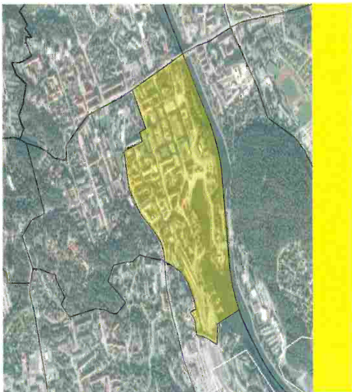
Figur 1 Jämförelse mellan inrapporterade händelser i centrum till 2015/2016 till systemet Gemensamlägesbild. Minskning framför allt av antalet narkotikabrott (mått på polisen aktivitet) viss minskning av antal misshandlar och rån.