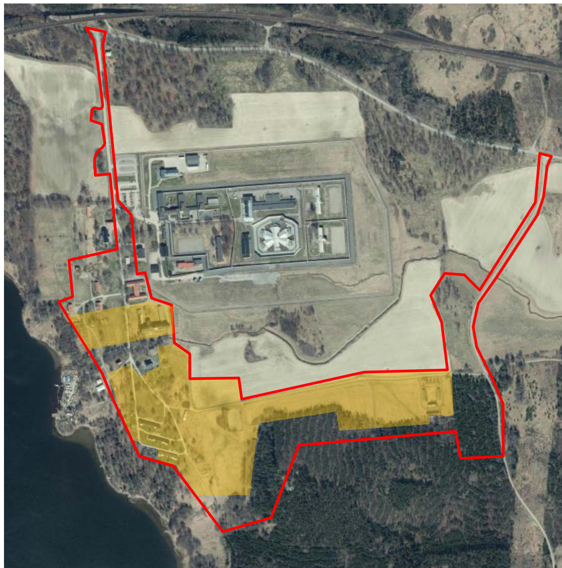
Samrådsförslaget (350-400 bostäder)