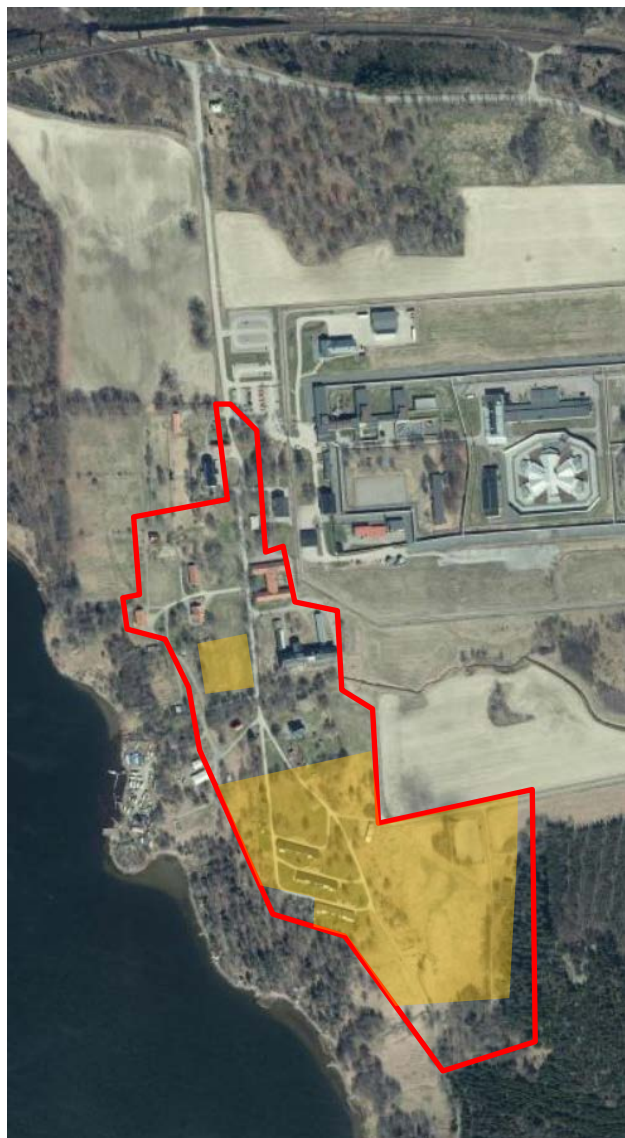
Förslag efter samråd (ca 50 bostäder)