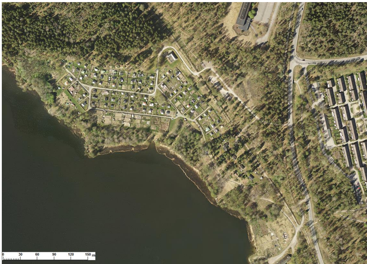
Flygfoto (ortofoto år 2016)