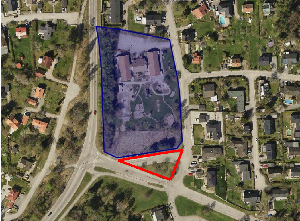
Föreslagen utökning av fastighet markerat med rött.

Fastigheten är lokaliserad i Brunnsäng, öster om Birkavägen. Telge Fastigheter ansöker om en detaljplaneändring för att möjliggöra för större förskolegård. Det planeras en tillbyggnad av Årsbokens förskola (utöka antal platser från 77 till 120) och med detta behövs en större gård. I direkt anslutning till fastigheten ligger idag en nedlagd bussvändslinga som sökande föreslår att omvandla till S-tomt.