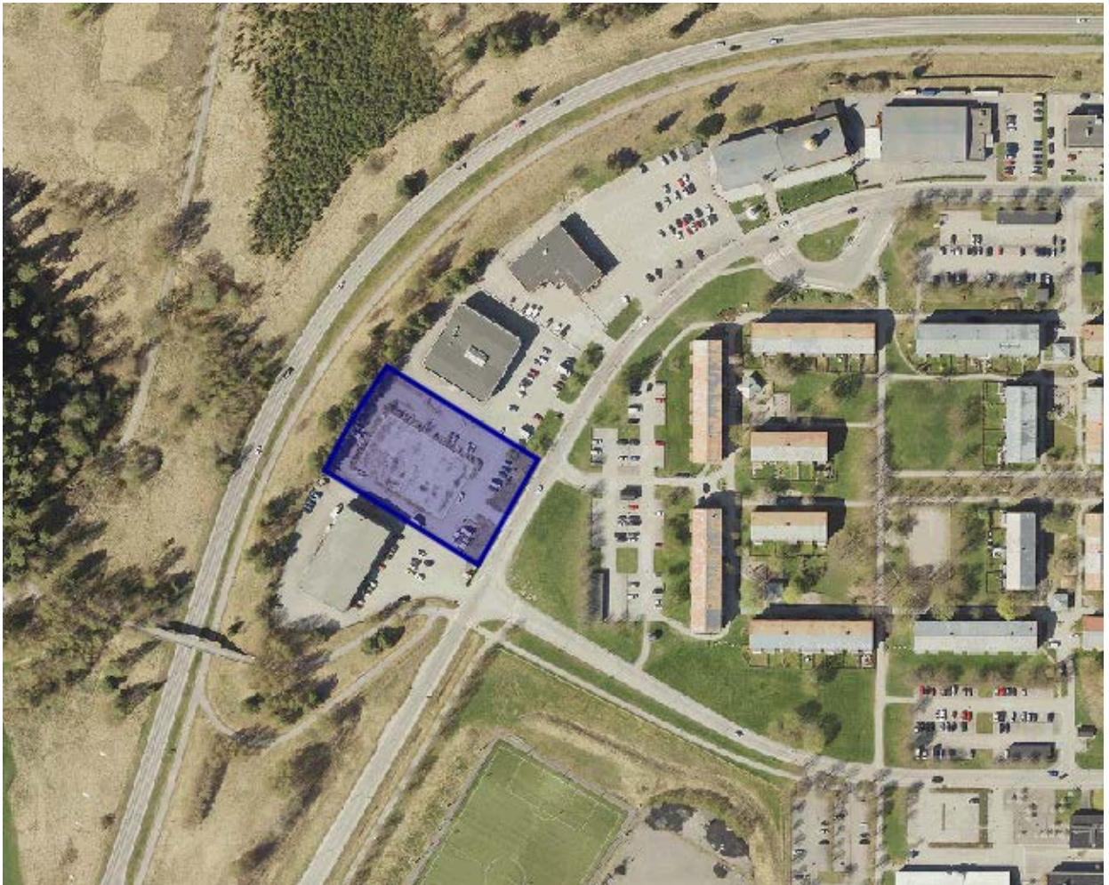
Ortofoto från 2016.

Gällande stadsplan är från 1986 och anger handel i 2 våningar, ej livsmedel. En ändring av detaljplan har gjorts 2015 som avser byggnadshöjden som har höjts från 4 meter till 7,5 meter. Genomförandetiden finns kvar och löper till och med 2020-02-23.